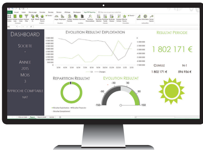
Dashboard du Résultat d'exploitation