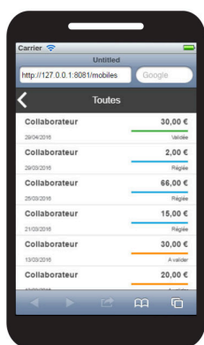
Sage FRP 1000 Notes de frais - Tableau de bord manager